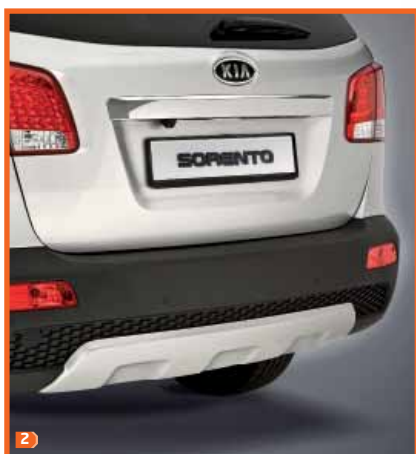
2 Protection de carter arrière 2P410ADE20