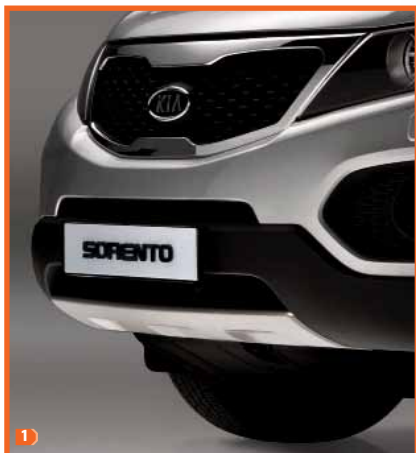
1 Protection de carter avant 2P410ADE10