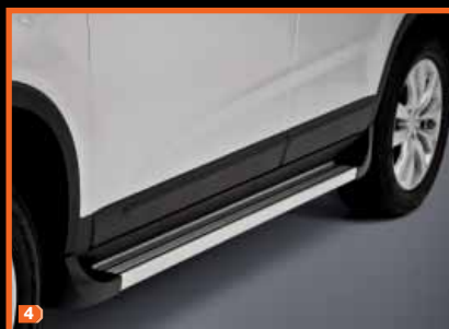
4 Marchepieds intégrés en résine et alu 2P370ADE00